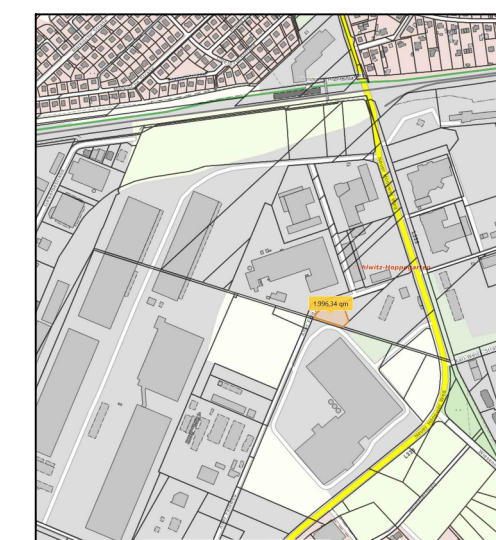
Übersicht Hoppegarten mit Geltungsbereich des Bebauungsplanes "Alter Feldweg 7"